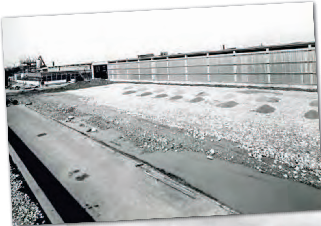
Byggeriet af centrallageret på Rørvang, juni 1965.