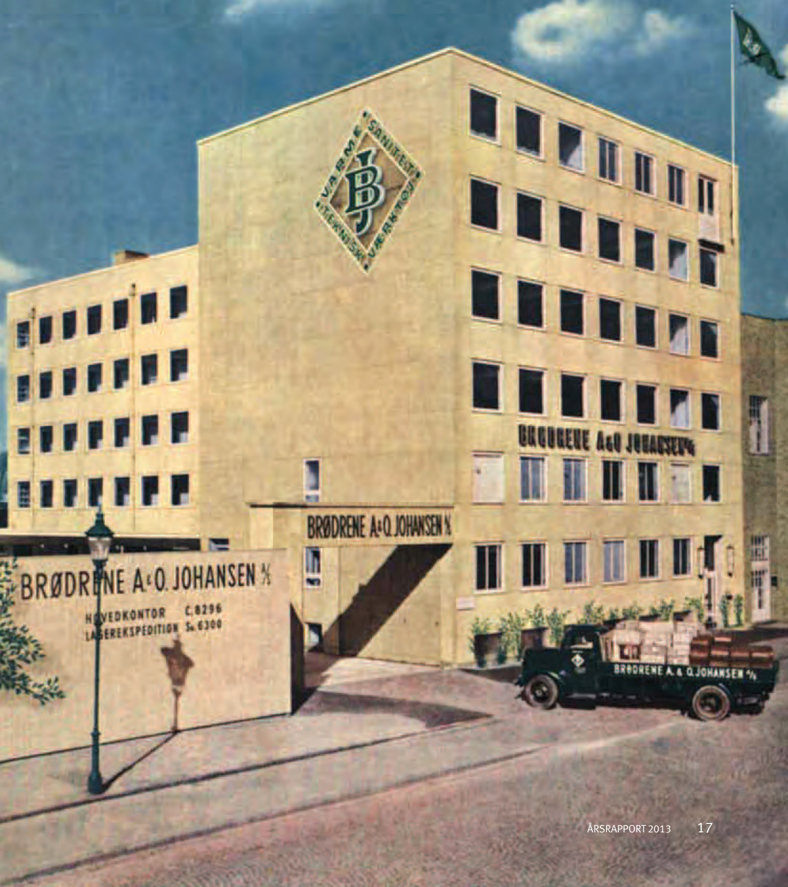
1948 - Lager og ekspedition, Vermlandsgade 67.