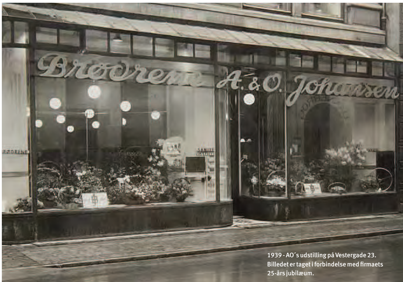
1939 - AO's udstilling på Vestergade 23. Billedet er taget i forbindelse med firmaets 25-års jubilæum.