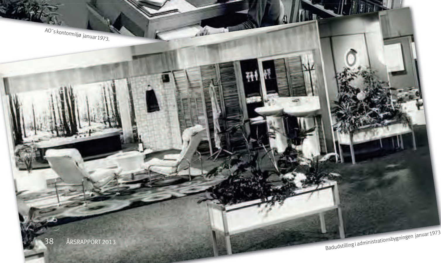
Badstilling i administrasjonsbygningen januar 1973.