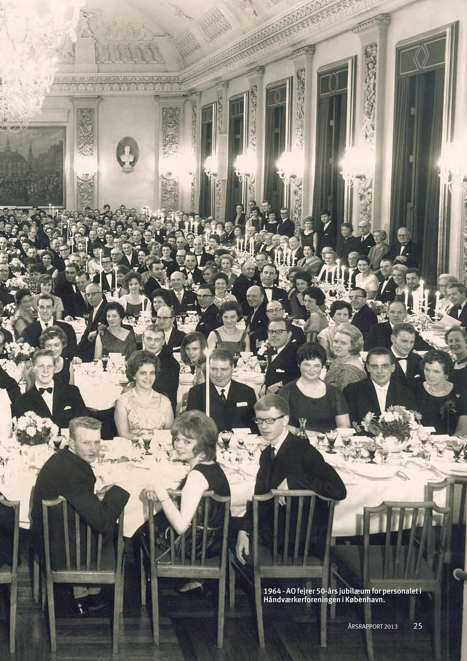
1964 - AO fejrer 50-års jubilæum for personalet i Håndværkerforeningen i København.