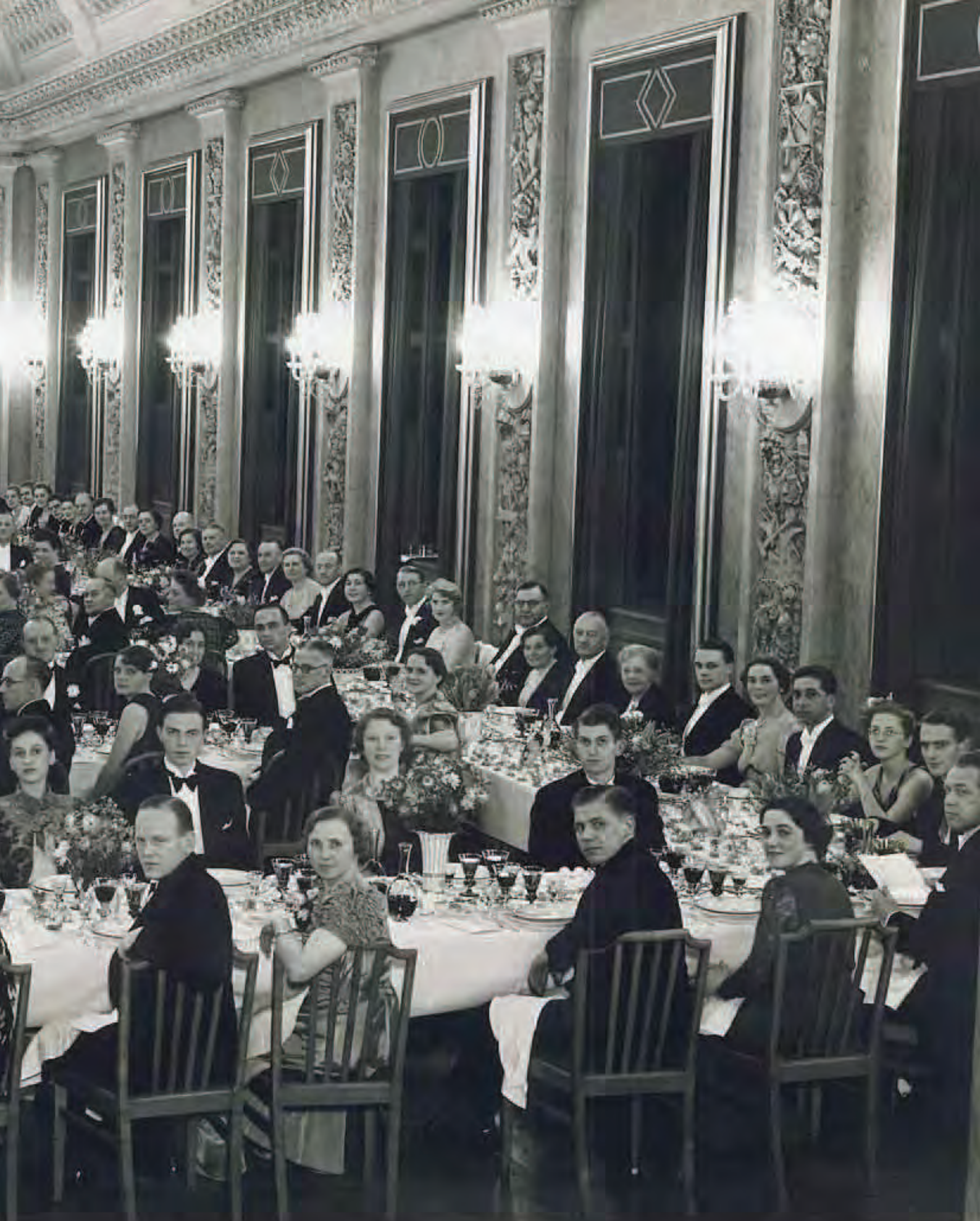
1939 - AO fejrer 25-års jubilæum for personalet i Håndværkerforeningen i København.