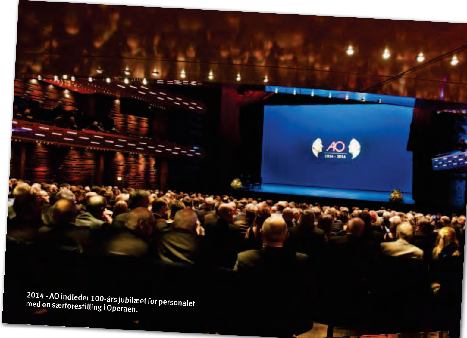
2014 - AO indleder 100-års jubilæet for personalet med en særforestilling i Operaen.