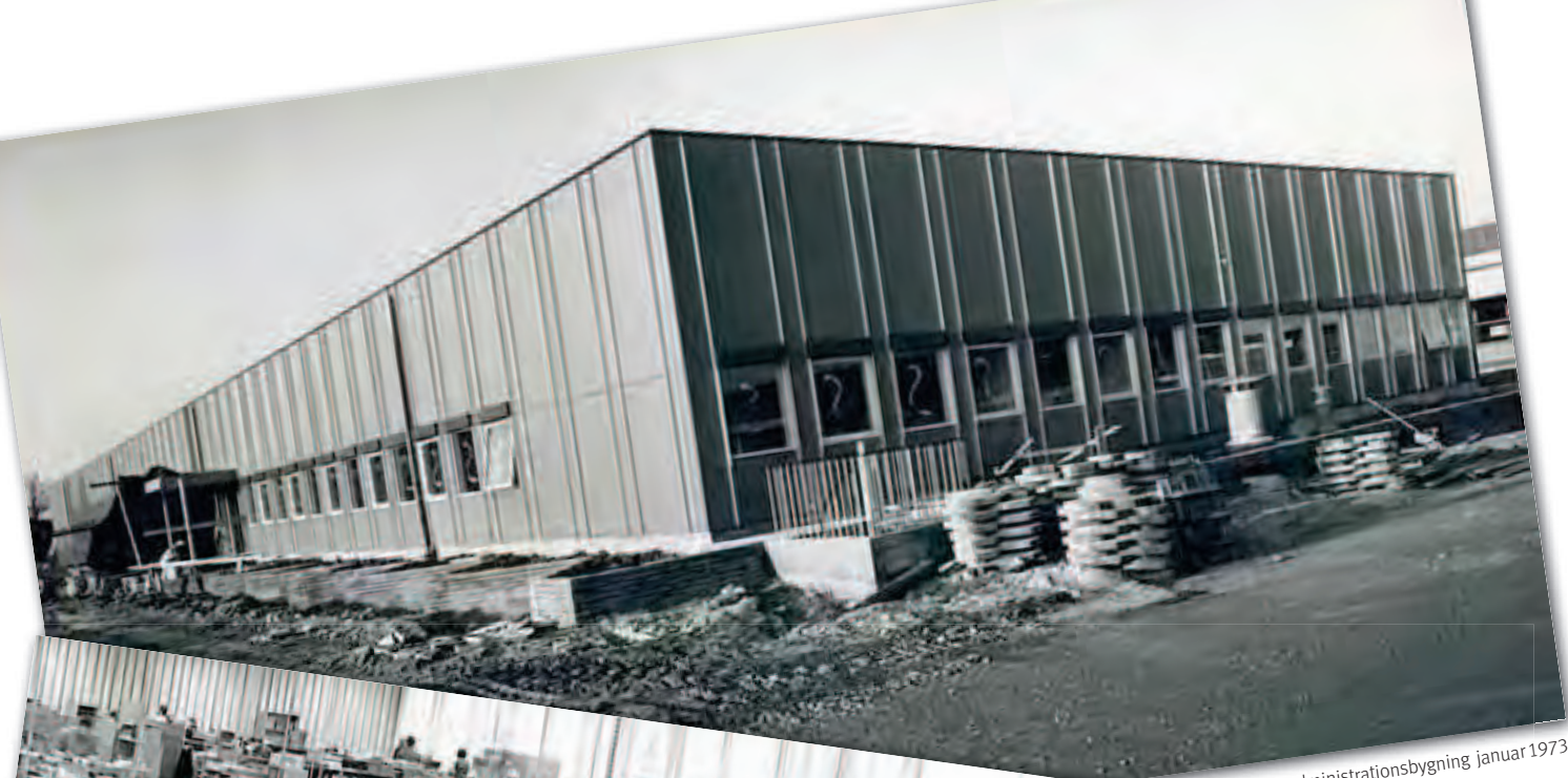
AO's administrasjonsbygning januar 1973.