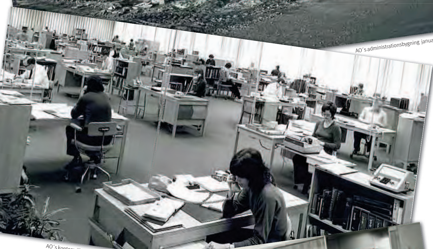
AO's kontormiljø januar 1973.