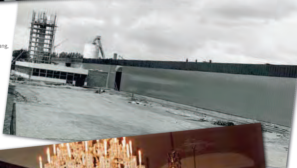
Centrallager Rørvang, august 1965.