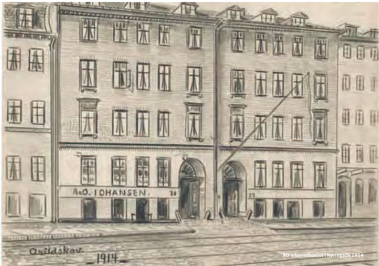
AO's hovedkontor i Nørregade 1914