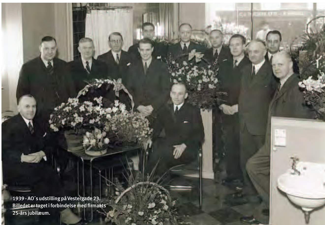
1939 - AO's udstilling på Vestergade 23. Billedet er taget i forbindelse med firmaets 25-års jubilæum.