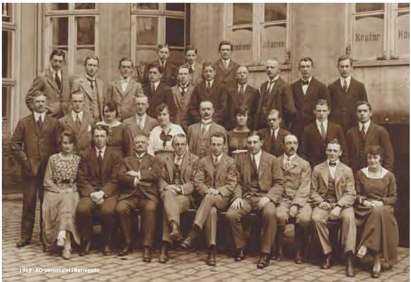
1919 - AO-personalet i Nørregade