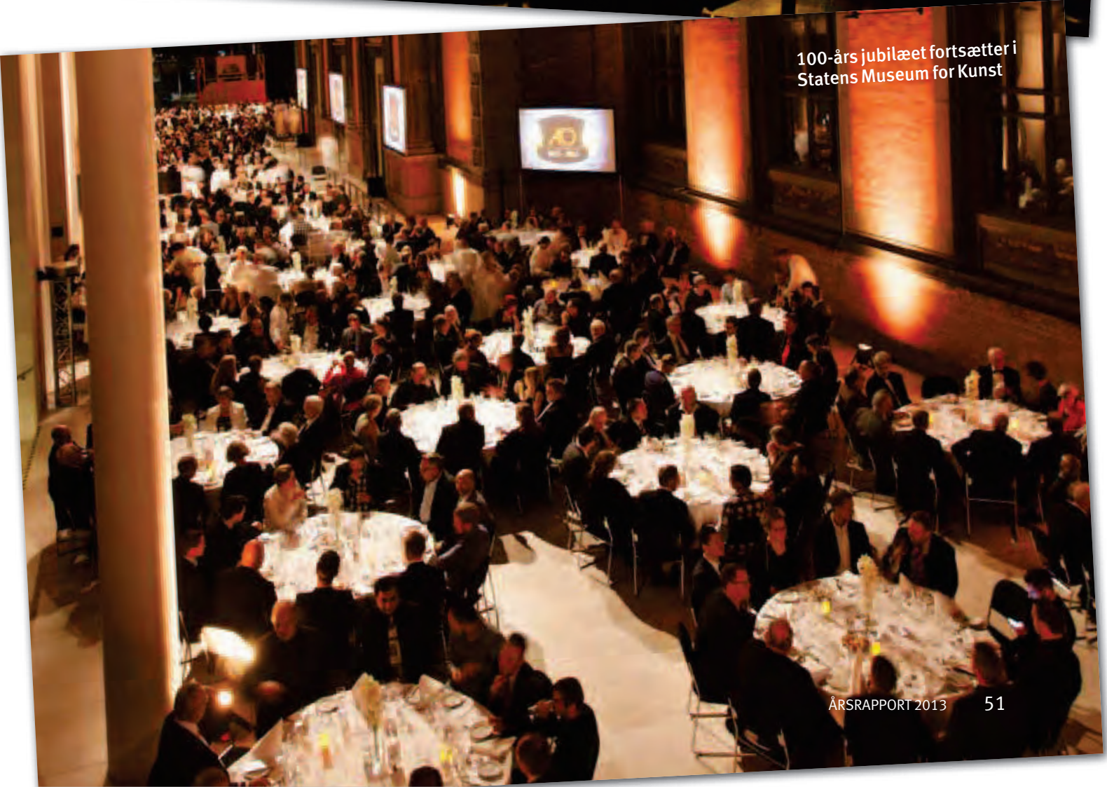
100-års jubilæet fortsætter i Statens Museum for Kunst